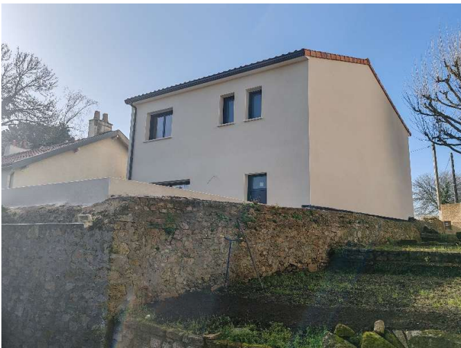
Les + du chantier