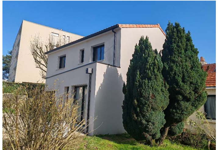
Les Acteurs du chantier